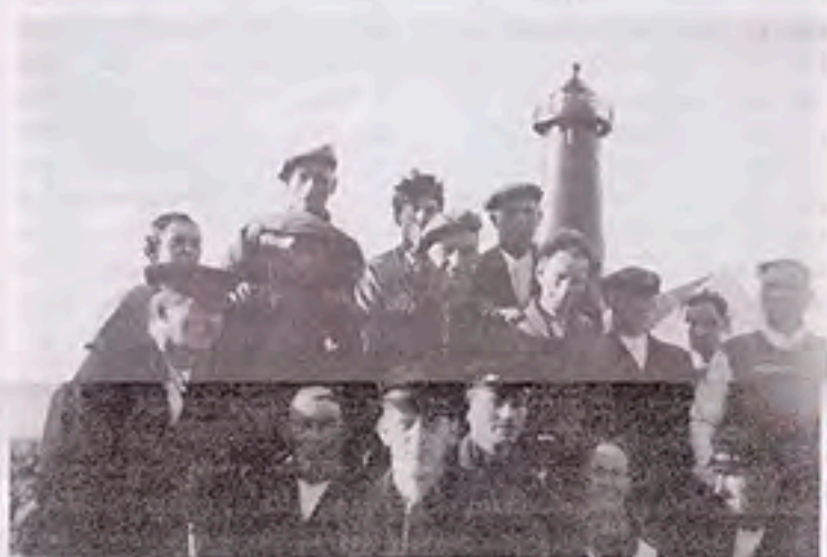
Mange var involvert da Tranøy fyr ble nytt i 1935-36. Her noen av dem sammen med besøkende.