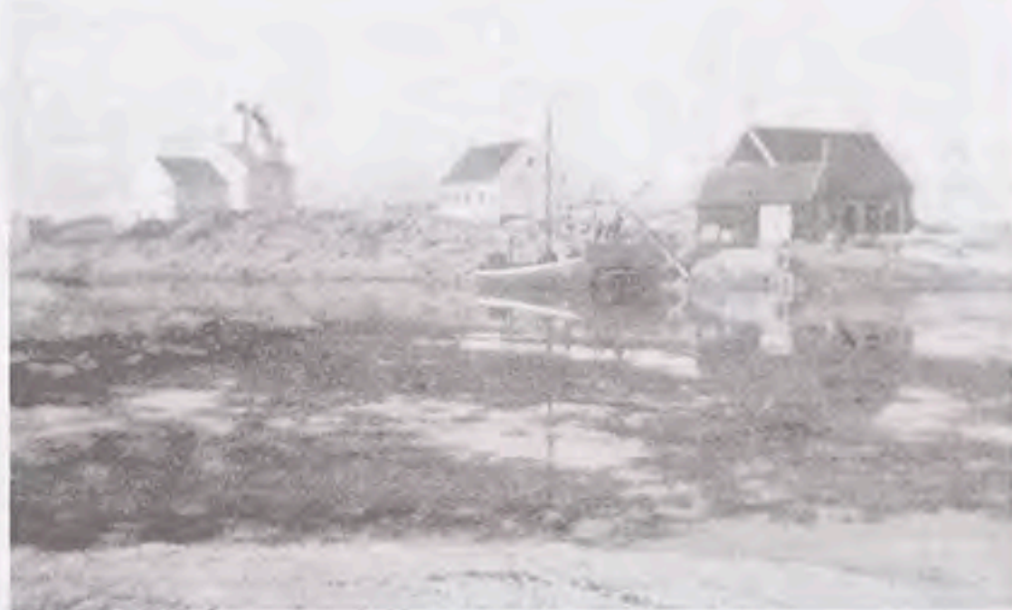
Ar er gått. Tranøy fyr tidlig trettital?

Like etter århundreskiftet ble det bestemt å gjennomføre de gamle planer om et fyr på Barøy. Det medførte at det kom henstilling fra skipper- og losforeningen om å «flytte» Tranøy fyr til Bjørvågodden, fordi det nye fyret kunne komme til å bli forvekslet med fyret på Tranøy. Slik gikk det ikke. I 1903-04 ble det heller foreslått å utstyre Tranøy fyr med blinkapparat, og i 1910 ble det så montert en ny lykt og et fyrapparat som gav 2 lynblink hvert sjette sekund. I 1906 hadde fyret