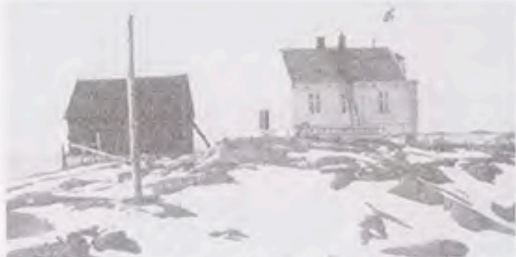
Gamle fyrstasjonen på Tranøy. Arstall og fotograf ukjent