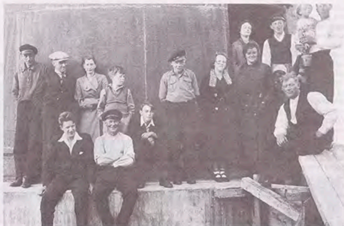
Tranøy fyr 1936. Folk på fyret, sannsynligvis en kombinasjon av ansatte, arbeidsfolk og besøkende. Noen som kjenner noen?

nedmontert, og flyttet til Tranøy der det ble reist opp (høyde 28 m). Fyrapparatet fra 1910 ble beholdt. Nederst – i første etasje ble det innredet maskinrom, i andre og tredje etasje ble 3 trykkluftstanker montert, mens i fjerde etasje ble diafonen mon-