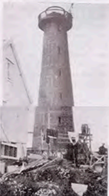
Tranøy fyr 1936. Tårnet er ferdig bygd og utstyr heises på plass.

Den store fyrstasjonen medførte at det måtte større bemanning til, den ble nå på fire mann mot tidligere en. På grunn av dette var det blitt bygd tre nye bygninger i tillegg til tårnet. En tomannsbolig, et uthus og nytt