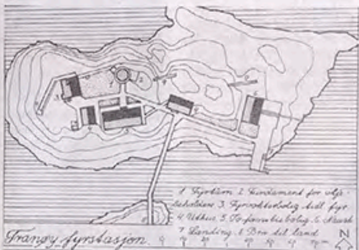
Kart over Tranøy fyrstasjon. Tegning etter oppmåling 1936. Men det skulle ennå gå mange år før brua til fastlandet kom på plass.