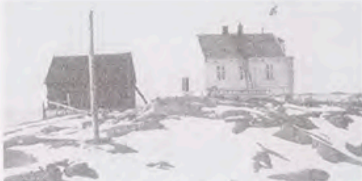
Gamle fyrstasjonen på Tranøy. Arstall og fotograf ukjent